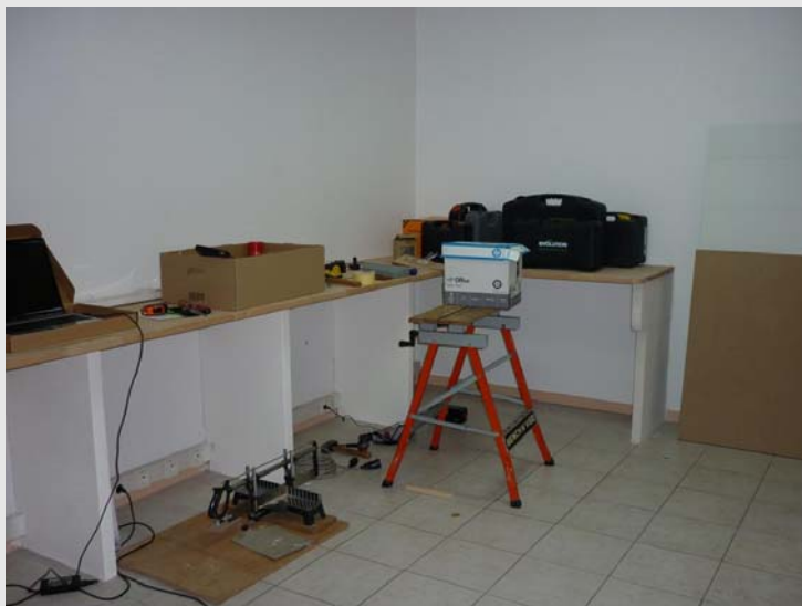
Plan de travail de la salle principale en construction

La largeur doit être au-dessus de 60 cm, je vous dis ça si vous décidez de prendre un plan de travail cuisine classique, 60 cm est trop juste et vous serez vite encombré, entre 65 et 80 cm est très bien, cela dépend de la longueur de vos bras, pour atteindre le fond du plan quand vous perdrez une vis, ne rigolez pas ça vous arrivera.