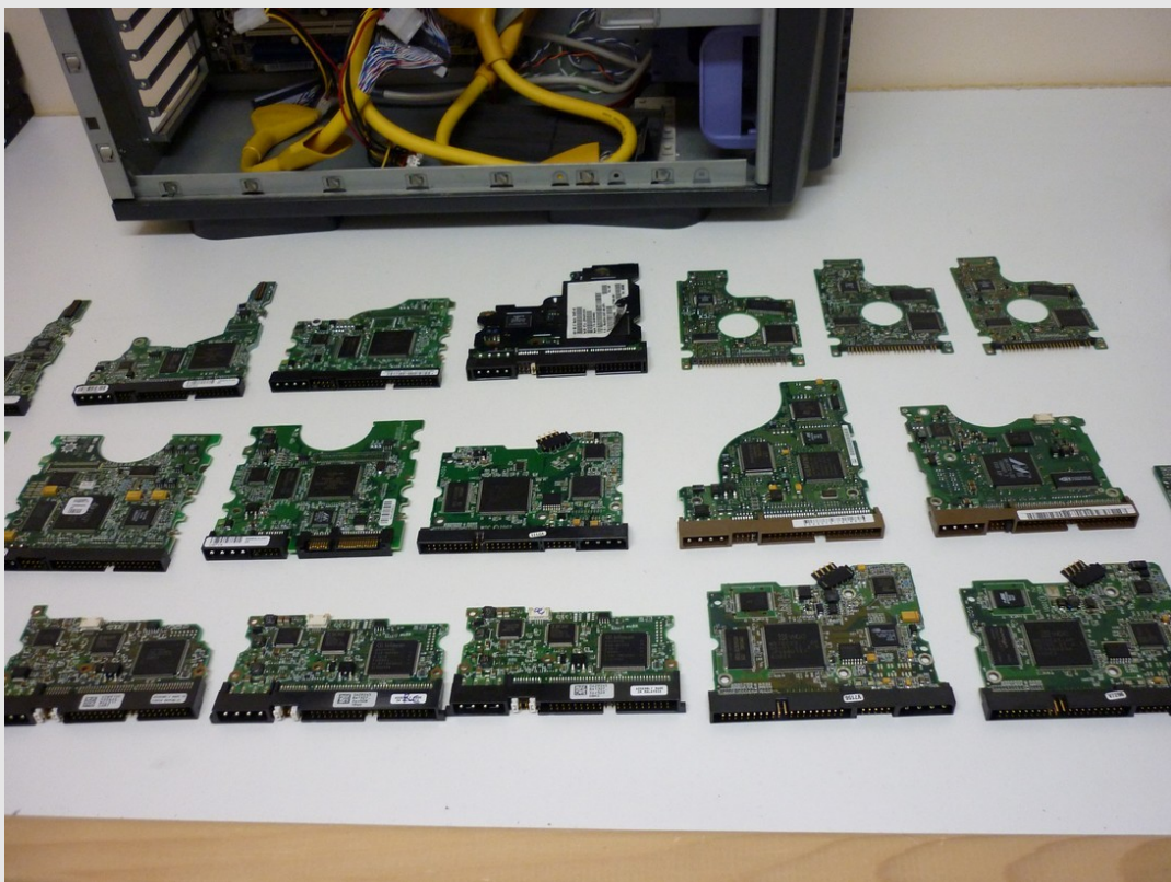
Une partie de ma collection

Je vous décris ici une méthode générale de réparation de carte contrôleur des disques durs, celle-ci vous permettra de réparer, si possible, la majorité de celles-ci.